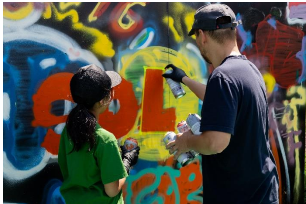
Village en Arts