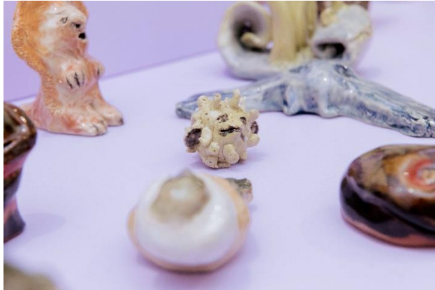
L'ECQSN du 17 juin au 29 oct.