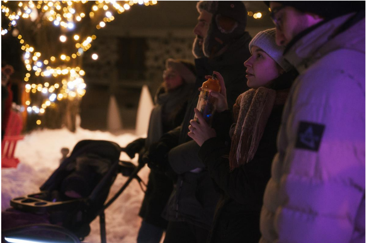
Graffiti numérique_Événement Féeries hivernales